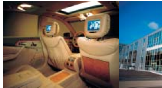
Fernseher in der Mercedes-S-Klasse entstehen ebenso wie der BRABUS-3,8-Liter-Motor im Bottroper Fertigungs- und Verwaltungsgebäude

Die schnellste Limousine der Welt. Die Produktpalette des Bottroper Tuning-Unternehmens reicht von Motoren mit gesteigerter Leistung über elegante Aerodynamik-Kits, hochwertige Leichtmetallräder und komfortable Sportfahrwerke bis hin zu hochwertigen Innenausstattungen. Und: BRABUS ist einer der exklusivsten Automobilhersteller überhaupt. In Bottrop wird die schnellste für Straßen zugelassene Limousine der Welt gebaut. Der 248 kW (582 PS) leistende Motor beschleunigt den BRABUS E V12 bis auf 330 Stundenkilometer. Nicht viel langsamer ist der von BRABUS getunte neue Mercedes CLK 500, der aus seinen 6,1 Litern Hubraum 313 kW (426 PS) herausholt. Bei einem maximalen Drehmoment von 621 Nm bei 4.100 Umdrehungen pro Minute beschleunigt der Sportwagen in nur 4,7 Sekunden von Null auf